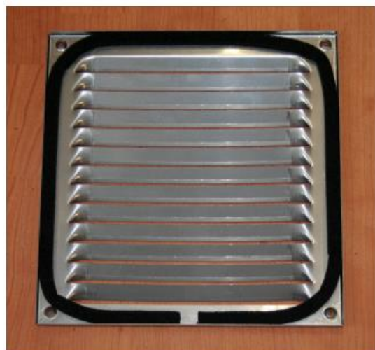
Obrázek 2: venkovní mřížka s těsnící páskou

Dodaná těsnící páska je schopna vyplnit nerovnosti pod mřížkou až do 3 mm. Při větších nerovnostech na fasádě, doporučujeme zakoupení těsnící pásky s roztažností 10 – 15 mm.